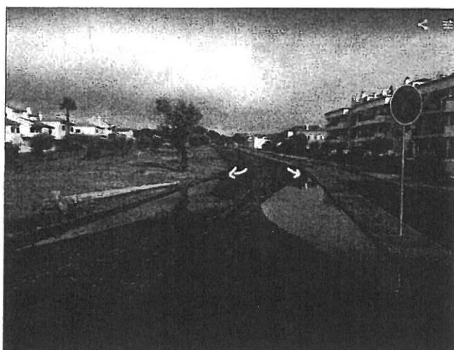
Foto 2 – Colocação das grelhas dos sumidouros fora da zona de acumulação de água, nova perspectiva