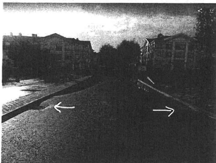
Foto 1 – Colocação das grelhas dos sumidouros fora da zona de acumulação de água

Após as primeiras chuvadas do início de Dezembro, verificou-se que o projecto encontrava-se no caminho certo, com um erro técnico de cálculo e de execução, onde as zonas de escoamento estão colocadas fora da zona de acumulação de água, como podemos ver nas figuras 1 e 2.